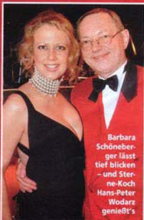
Barbara Schöneberger lässt tief blicken – und Sterne-Koch Hans-Peter Wodarz genießt's