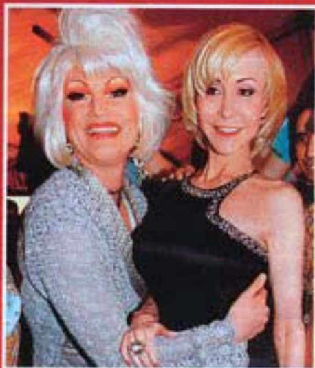
▲ Wo die sind, geht die Post ab: die langbeinige Drag-Queen Olivia Jones (links) und Busenstar Dolly Buster

Schauspielerin Gerit Kling wird von den männlichen Akteuren des „Pomp, Duck and Circumstance“ umgarnt ▶